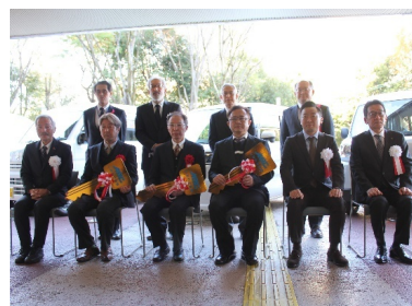
寄贈車両をバックに集合写真