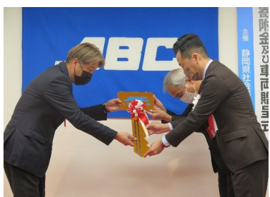
車両寄贈団体へのゴールデンキー授与