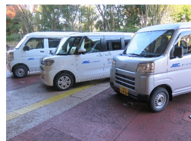
しあわせ基金より寄贈された3台の車両